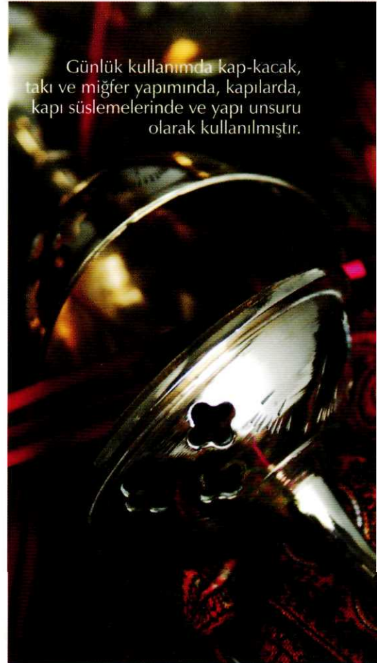
Günlük kullanımda kap-kacak, takı ve miğfer yapımında, kapılarda, kapı süslemelerinde ve yapı unsuru olarak kullanılmıştır.

müşü üç boyutlu nesne oluşturacak biçimde çeşitli desenler yaratarak, henüz ısıyla edinmediği plastik niteliğini kaybetmeden işleme tekniğidir. Takılar, fincan zarfları, kutular ve sürmedanlar bu teknikle yapılan büyüleyici güzellikteki sanat eserlerini bize sunmaktadır. Bir başka söz edilmesi gereken teknik ise "savat"tır. Savat metal yüzey, özellikle de gümüş üzerinde derin olmayan oyuklar açılıp içine siyah renkli bir eriyik doldurularak yapılan bezemdir. "Düz", "tırtıllı (perdaz)" ve "oyma" olmak üzere üç çeşidi bulunmaktadır. Bu teknikle daha çok kutu, saat, fincan zarfı ve ağızlık gibi eşyalar yapılmaktadır.