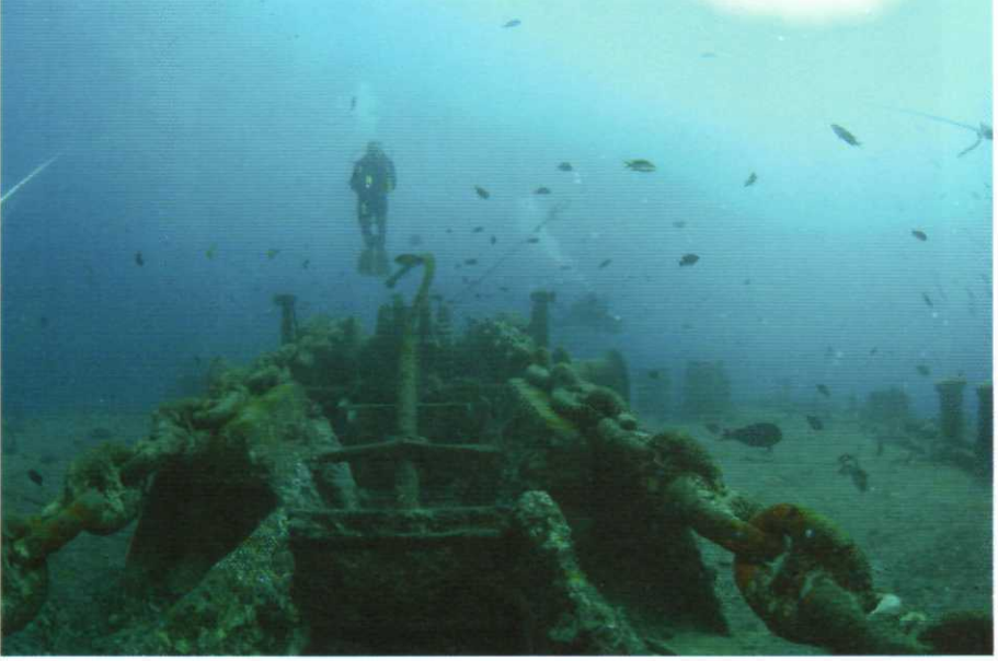
Resim 1. Tiran Thistlegorm batığı: Derin maviliğin içinde yatan Thistlegorm...