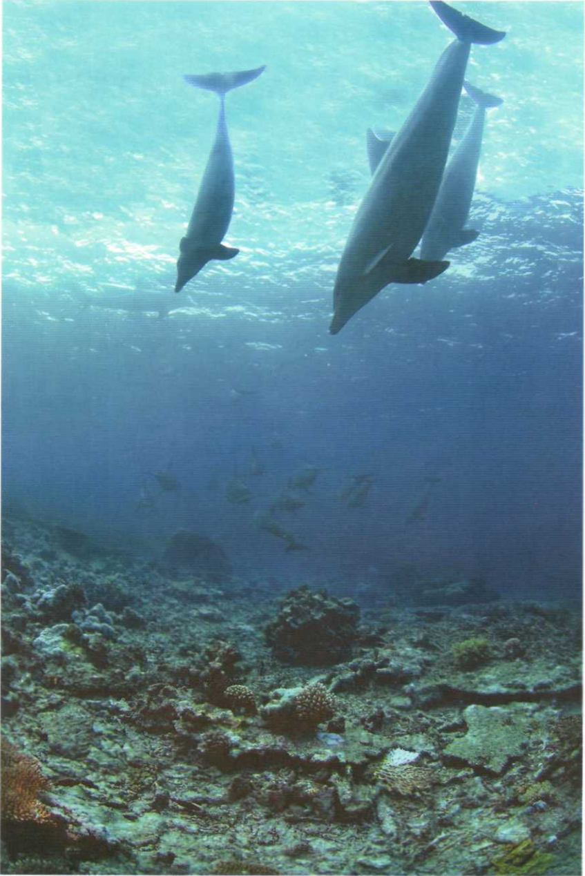
Resim XI. Denizlerin efendisi büyüleyici yunuslar gerçekten bizi şaşırtılar ve bizi çok güzel misafir ettiler...