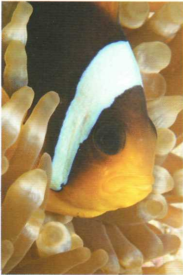
Resim VI. Anemonlar, Anemon balıklarına (Amphiprion bicinctus) ev sahipliği yaparlar.

bana "Ne alayım kamera mı yoksa fotoğraf makinesi mi?" diye sordu. "Belki yunuslar yanımıza gelirler." Ben de hocama dedim ki; "Siz kamera alın bende zaten fotoğraf makinesi var." Zodyak hemen bizi Reef üstüne götürüp attı ve ilk giden grup biz olduk. Bir baktık ki yunuslar geldiler, bizi kokladılar kendi ailelerinden saydılar. Bunun ardından dalışımıza, yüzmemize, fotoğraf çekmeye poz vermeye başladık.