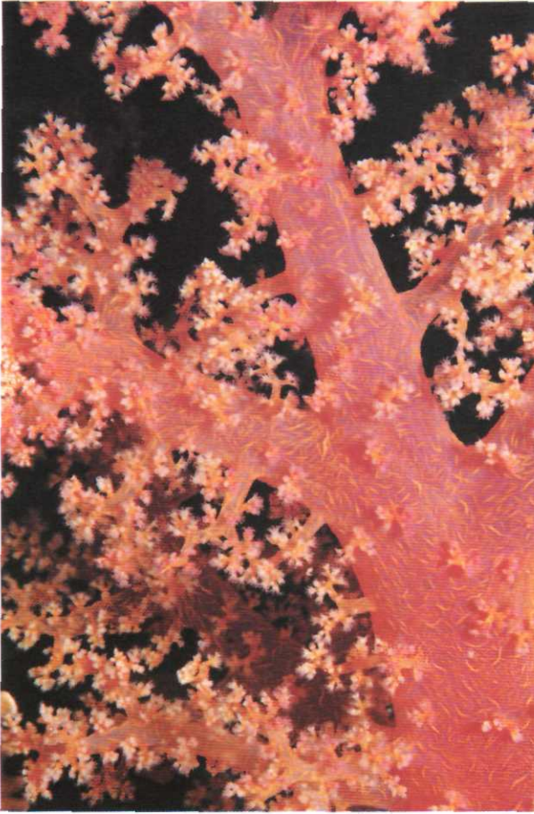
Resim IV. El değmemiş bir sualtı dünyası. O yumuşak mercanlar canlı renkleri ile muhteşem bir (makro) kontrast oluşturuyor.