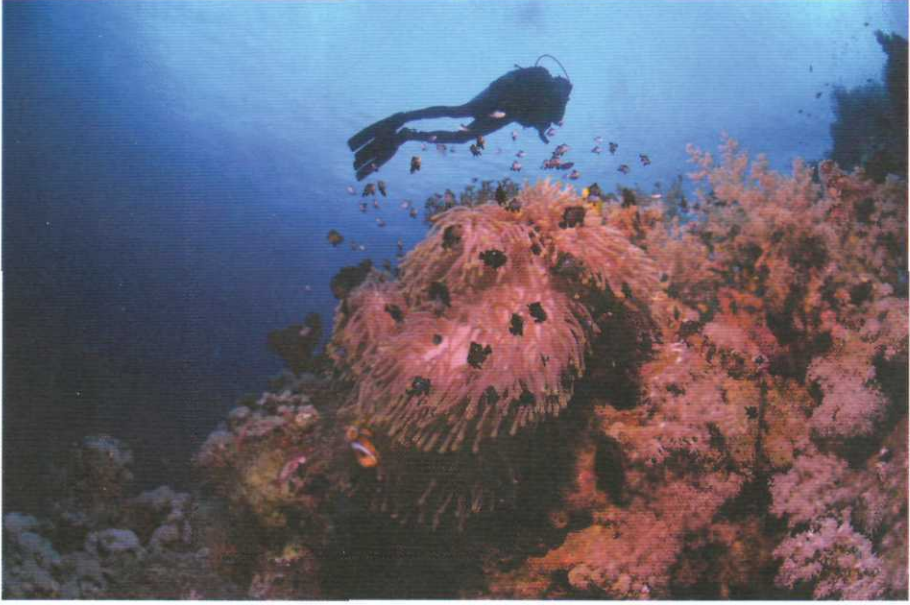
Resim V. Denizaltındaki derinliğe davetiye çıkartan Anemonlar.