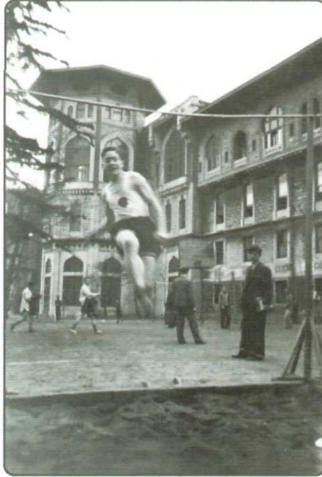
12.03.1942 8.55'lik atlayışı