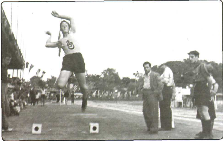
19.05.1941, İstanbul Liseleri Atletizm Şampiyonası