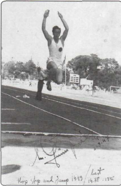
1945 Türkiye rekoru