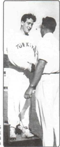
1945 Birincilik ödülünü alırken