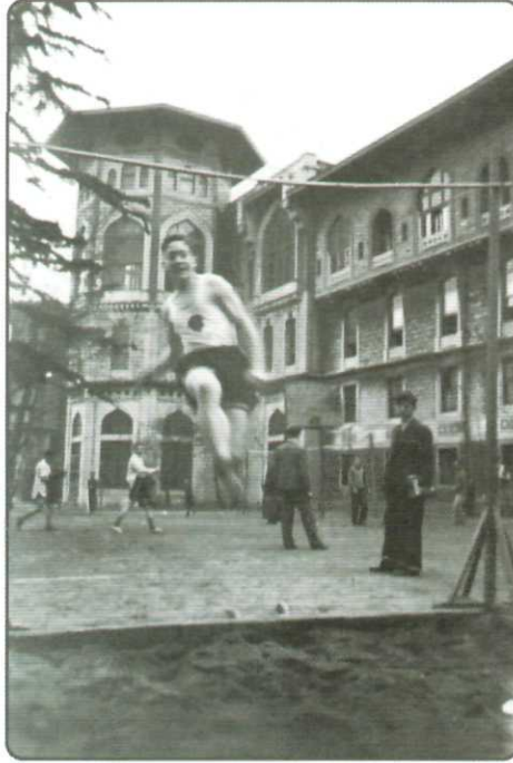
12.03.1942 8.55'lik atlayışı