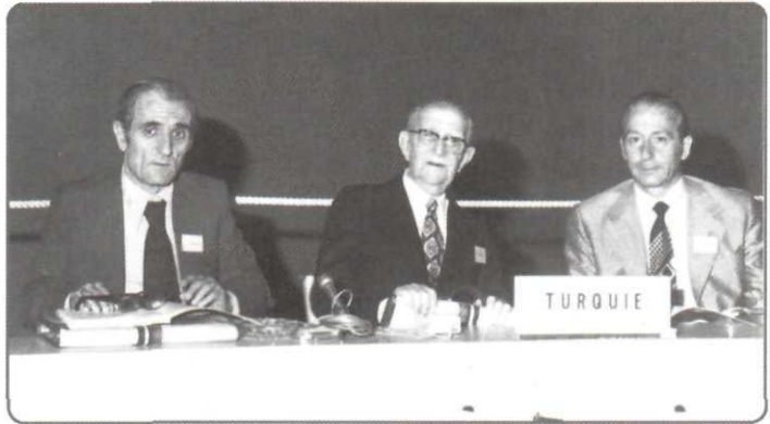
Rahmetli Burhan Felek'le bir Türkiye Olimpiyat Komite toplantısı, 1970'ler

23.05.1952, Atletizm Federasyonu Haberler Bülteni, sayı 46