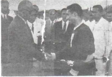
Sayın Başvekilimiz Güner'e kupayı verirken

1943 — 1944 ders yılı biterken mektebimiz kendisinin ve memleketimizin spor tarihine şerefli bir sayfa daha ilâve ediyor.