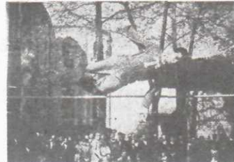
Selim Yalın yüksek atlarken