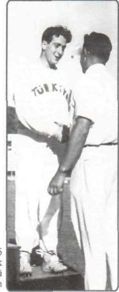
1945 Birincilik ödülünü alırken