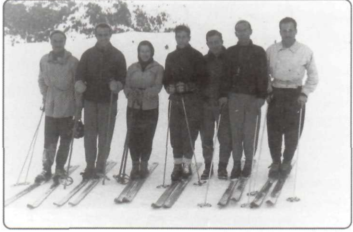
1947, Uludağ, Spor Arkadaşları