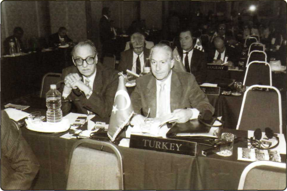
1986, Turgut Atakol ve Güner Frik Uluslararası Olimpiyat Komitesi toplantısı