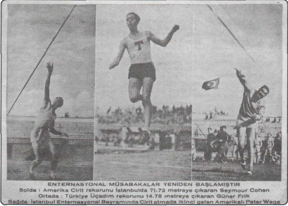
1945, Türkiye üçadım rekorunu kırarken