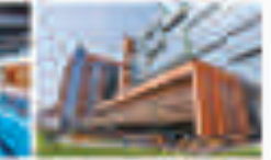
Geniş ve Akademi Kaliteli Yaşam Alanları (Eğitim)

Acibadem Üniversitesi, yüksek teknolojik donanımlı, estetik ve yaratıcı bir mimari anlayışla tasarlanan, bilime ve modern eğitime kapıları açan bir bilgi üssü.