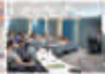
Geniş ve Akademi Kaliteli Yaşam Alanları (Eğitim)