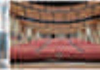
Yüksek Kaliteli Ses Sistemleri