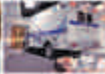
Yüksek Sağlık Kalitesi Fiziksel ve Psikolojik Dinlenme Alanları Akademi Eğitim