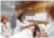
Özellik Nefis Özgün Tasarımlar ve Güncellenmiş Akademi Çalışma Alanları