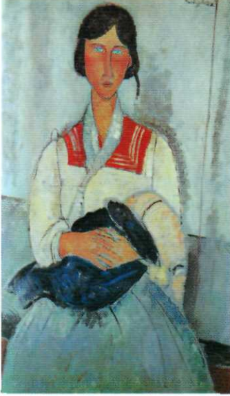
Çingene (1917) Tual üzerine yağlıboya 46 2/5 in. x 29 1/5 in. Ulusal Sanat Galerisi, Washington

Bu kadına neden "Çingene" adı verildiği belli değildir. Belki de bu başlığın nedeni kadının açıkta kalan saç örgüsü ve giysisinin biçimidir. Kim olursa olsun, Modigliani onun soyluluğunu sezmiş ve duvar renginde de tekrarlanan etekliliğinin ve eşarabının zarif sedeflenmeleriyle bunu yaymaya çalışmıştır. Kompozisyondaki koyu renkli kitleler küçüktür ve birbirini çok güzel dengelemektedir. Sedefimsi tonların üstündeki mavi lekeler, burun ve ağız kenarlarında ve parmakların çevrelerinde görülmektedir. Boyutlara katkıda bulunurken, mavi bakışları yansıyan modelin, gözlerinin mavisini de vurgulamaktadır. Gösterişsiz beyaz bluz, dalgalı kenar çizgileri ve olağandışı gölgeler kullanılmıyorsa, duvardan hemen hemen ayrılmayacaktı. Burada ışık ve gölge farkı Modigliani'de her zaman gördüğümüz iskemlenin geriye doğru uzanan çizgilerinden fazla, bebek ile anne arasındaki boşluğu, kadın ile duvar arasındaki derinliği belirtmektedir.