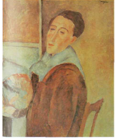
Kendi Portresi (1919) Detay Tual üzerine yağlı boya 40 in. x 26 in. Sao Paulo Üniversitesi Çağdaş Sanat Müzesi

Bu kadına neden "Çingene" adı verildiği belli değildir. Belki de bu başlığın nedeni kadının açıkta kalan saç örgüsü ve giysisinin biçimidir. Kim olursa olsun, Modigliani onun soyluluğunu sezmiş ve duvar renginde de tekrarlanan etekliliğinin ve eşarabının zarif sedeflenmeleriyle bunu yaymaya çalışmıştır. Kompozisyondaki koyu renkli kitleler küçüktür ve birbirini çok güzel dengelemektedir. Sedefimsi tonların üstündeki mavi lekeler, burun ve ağız kenarlarında ve parmakların çevrelerinde görülmektedir. Boyutlara katkıda bulunurken, mavi bakışları yansıyan modelin, gözlerinin mavisini de vurgulamaktadır. Gösterişsiz beyaz bluz, dalgalı kenar çizgileri ve olağandışı gölgeler kullanılmıyorsa, duvardan hemen hemen ayrılmayacaktı. Burada ışık ve gölge farkı Modigliani'de her zaman gördüğümüz iskemlenin geriye doğru uzanan çizgilerinden fazla, bebek ile anne arasındaki boşluğu, kadın ile duvar arasındaki derinliği belirtmektedir.