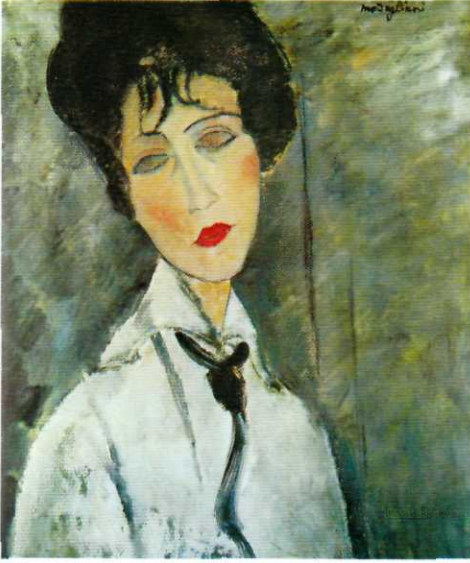
Kravatlı Kadın (1917) Tual üzerine yağlıboya 26 in. x 20 in. Özel Koleksiyon, Paris

Modigliani'nin çizgiyi kontrollü kullanımı bu tualin üstünden altına kadar uzanan arabeskte, kadının başının üstünden, sağ yanağına, oradan da sağ omzu ve kolu boyunca inen çizgide belirgindir. Ritmik eğriler uçuşan kravata paraleldir. Bu resimde bir zarafet ve soyluluk havası vardır, geri planın işleniş de buna katkıda bulunmaktadır. Bu resimdeki arka plan, resmin tümünde aynı şekil ve ustalıklarla birleştirilerek uygulanmış neredeyse tamamen soyut bir alandır. Figürün beyaz ve siyah renk tonlarına yumuşak fırça darbeleriyle sürülmüş parlak renkler karşı tonlar oluşturmaktadır. Bu karşıtlık resmin hemen hemen ortasında bulunan çok parlak bir alanla, kadının kırmızı dudaklarıyla daha da belirginleştirilmiştir. Modelin zarafeti, kesin çizgilerden şeklin gevşek görüntüsüne geçilerek daha iyi anlatılmıştır. Oval başın sert çizgileri daha sonra gövdenin oynak çizgilerine, kravatın uçlarının ince çizimine ve bluzun alt kısmına açılır.