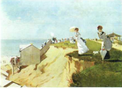
LONG BRANCH, NEW JERSEY (1869) Tual üzerine yağlıboya 16 in. x 213/4 in. Güzel Sanatlar Müzesi, Boston

Bu nefis resim çoğu kimsenin Homer'le bağdaştıramayacağı bir üslûbunun ve konunun temsilcisidir. Bu, yaşamının sonlarına doğru inzivaya çekilen ve bir kadın düşmanı diye bakılan kişinin çalışması olamaz denebilir. 1860'larda, 70'lerde sayfiyedeki yaşamı, özellikle Amerikalı kızların giyimlerini ve eğlencelerini resmetmekten hoşlanmaktaydı. Bu resim, bomboş, hiç kimsenin yer almadığı son yıllarının manzara resimlerinden çok farklıdır. Burada gösterilen dalgasız, sakin okyanus, bulutsuz gökyüzü sadece mutluluk vaat etmektedir. İnsan figürleri ve barnaklar plajın ve tepelerin eteğindedir, doğayı uysallaştırıp evcilleştirmektedir. 1868'de Fransa'dan döndükten sonra, Homer'in renkleri parlaklaşır, kompozisyonlarını birleştirmek üzere, renkleri ustalikle kullanır. Örneğin, kadının şapkasındaki ve şemsiyesindeki kırmızı, soldaki balkondan sarkan kırmızıyla ve uzakta, merdivenlerin üstündeki kadının kırmızı eteğiyle bir üçgen oluşturur.