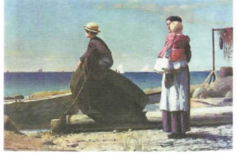
BABALARINI BEKLERKEN (1873)

Bununla beraber modern sanat sorunlarının geleceğini gösteren tamamıyla yeni bir öznellik gücüne ve soyutluluk derecesine ulaştı. 29 Eylül 1910'da Maine'da öldü.