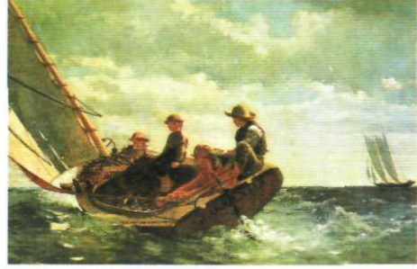
PUPA YELKEN (1876) Tual üzerine yağlıboya 24 in. x 38 in. Ulusal Sanat Galerisi, Washington D.C. (W. L. ve May T. Mellon Vakfı armağanı)

Ruh âlemindeki ve açık hava üslûbındaki benzerliklere rağmen Homer'in Fransız çağdaşlarından doğrudan doğruya etkilendiği söylenemez, şekilleri zariftir, fakat kesin çizgilerle çizilmiştir, ana hatları ne yumuşatılmış ne de ışığın etkisiyle erimiştir.