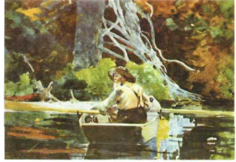
ADİRONDACK REHBERİ (1894)

Renklerin çizgisel sınırları aşmaması gerektiği gerçeği kuru ve statik bir sonuç vermektedir. Boyutları kusursuz, güzel çizilmiş ve özellikle hiçbir yaşam işareti görülmeyen figürler, sanki manzaraya zorla oturtulmuştur. Bununla beraber kompozisyon dikkatle hafifçe öne eğilmiş vücutlarıyla zıt görüntüler vermektedir. Ölü balıkların ve geminin gölgesinin sert yatay çizgileri çocukların dalgalı gölgelerini çerçevelemektedir.