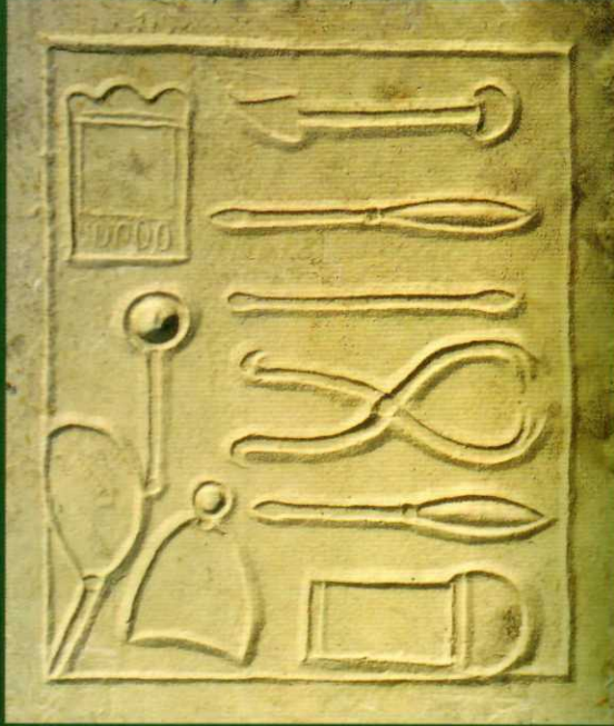
Cerrahide kullanılan aletleri betimleyen rölyef, Roma, 1. Yüzyıl