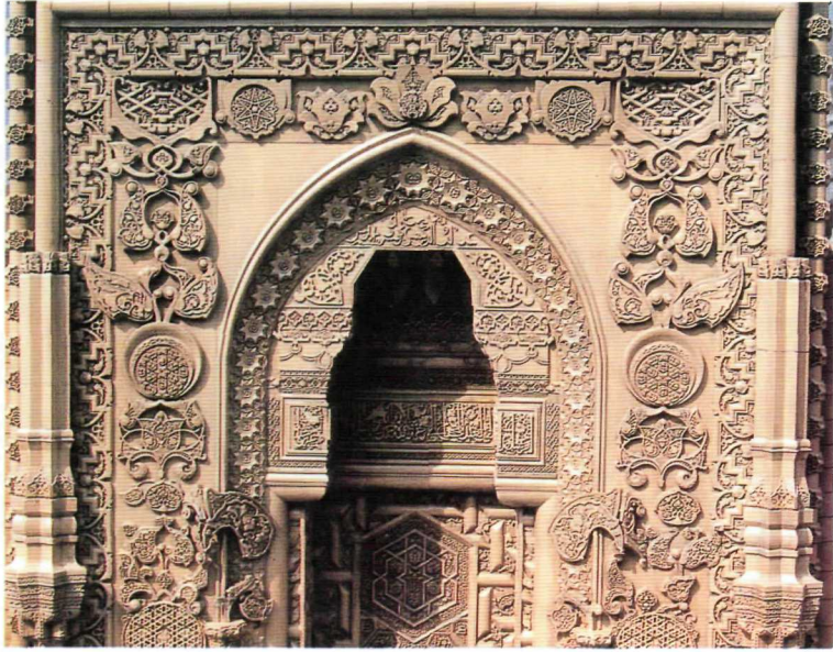
Divriği Ulu Camii portalı