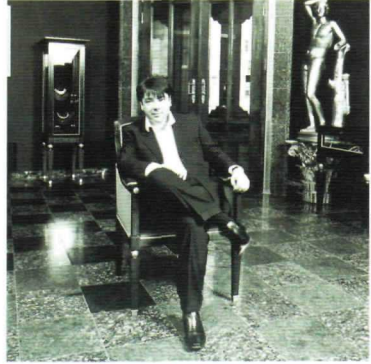
Valentine Yudaçkin "Yeni zengin Rusların en sevdiği modacı"

ve diğerleri bu sergide sanatseverlerle tanışıyor.