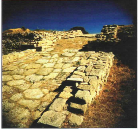
Troia II katından rampa görünümü

sergilenecek. Bunların yanı sıra, çeşitli illüstrasyon ve fotoğraflar, Troia IV döneminin en iyi izlenebildiği D7/8 karesinde ortaya çıkarılan zengin buluntulu bir mutfağın envanteriyle birlikte canlandırılması, o dönemin günlük yaşamı hakkında önemli fikirler verecek. Yüksek Anadolu Kültürü adı verilen dönemi tanıtmak için yukarıda bahsedilen detaylar ön planda tutularak döneme ait çanak-çömlek -gri minyas malı ve tan malı adı verilen döneme ait has keramikler, küçük buluntular, çarpıcı rekonstrüksiyon ve illüstrasyonlar ile fotoğraflarla açıklanacak. Özel bir programla açılacak olan sergi kapsamında, panel, şiir dinletisi, barkovizyon gösterimi gibi etkinlikler de yer alıyor.