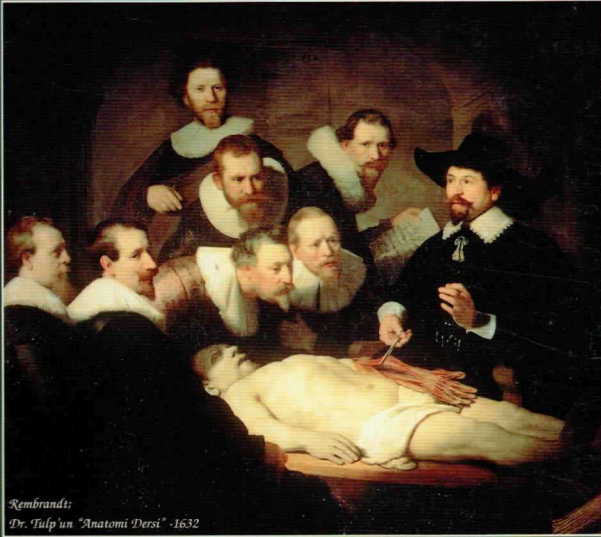
Rembrandt: Dr. Julp'un "Anatomi Dersi" - 1632