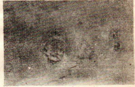
Şekil : 4 — Nadir, Tifo

4 — Reşat Kerim, 7 yaşında. 31.7 tarihinde, 15 gündenberi hasta olduğundan dolayı, kliniğe getirilmiştir. Geldiği zaman kendini tamamile bilmiyecek vaziyette, hararet derecesi 39, turgor, tonus azalması, çok zayıf, dudaklar kuru ve kabuklu, dil pash, vücudün ötesinde berisinde gangren plaque'ları vardı. Bilhassa yüzün sağ tarafında temporalis nahiyesinde, el ayası kadar ve appendix'de bir liralık ka-